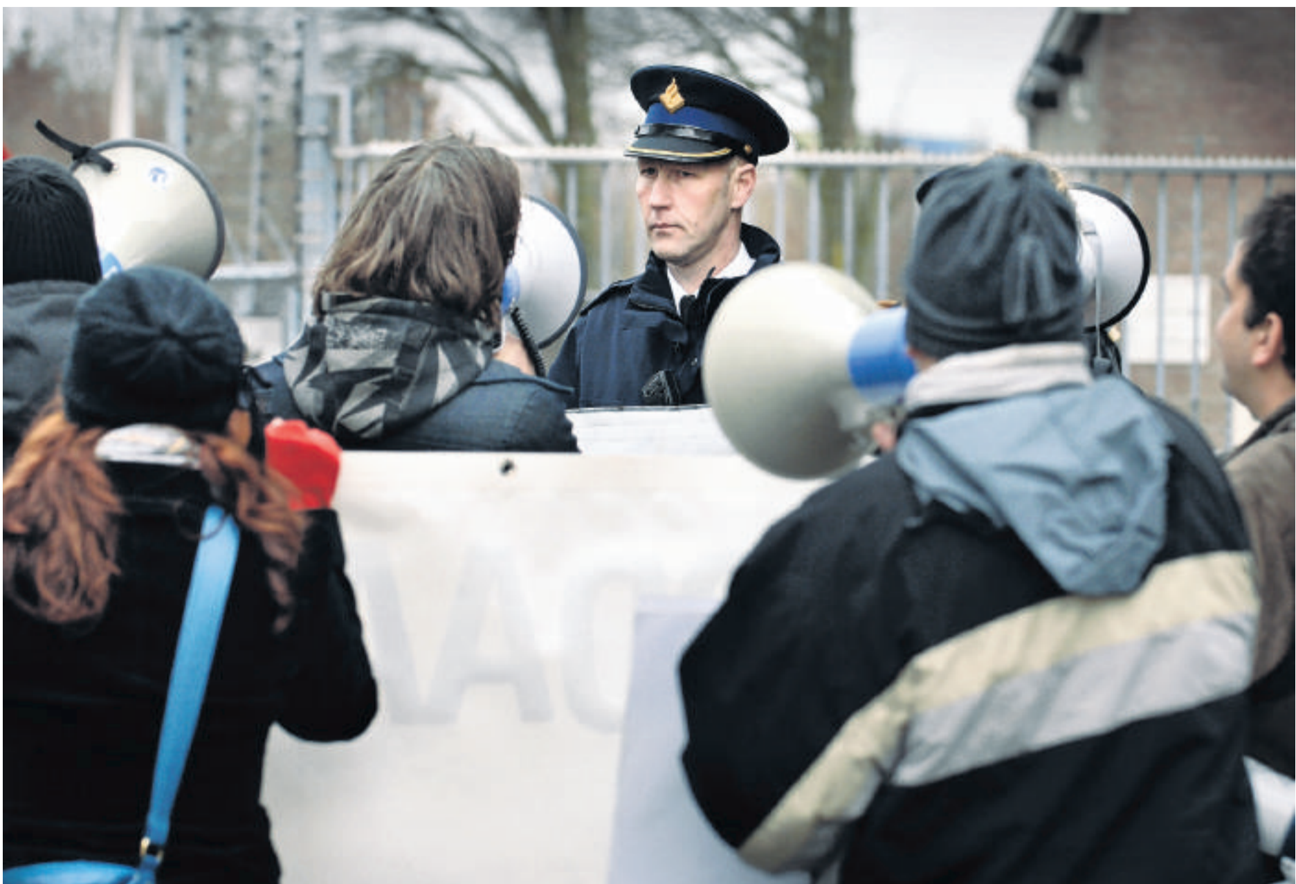
De Anti Dierproeven Coalitie protesteert in januari 2008 bij proefdierfokkerij Harlan in Horst. De politie voorkomt dat activisten het terrein opgaan.

2. Er is steeds meer behoefte aan organisaties die niet alleen opkomen voor de materiële belangen van professionals, maar ook voor de vakinhoudelijke kwaliteit van hun werk, voor hun beroepsideal en hun beroepsethiek. Bestaande organisaties zoals brancheorganisaties, vakbonden of beroepsorganisaties hebben daar onvoldoende weerklank aan gegeven. In alle (semi)publieke sectoren zijn echter tegenbewegingen ontstaan. Zo werd een tijd terug bijvoorbeeld NU'91 al opgericht omdat de reguliere vakbonden on-